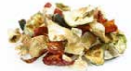
e molto altro! ...and much more!

L'essiccazione è una via ideale alla conservazione praticamente per ogni alimento. Nei pochi casi in cui non è consigliabile, ad esempio con alimenti ad alto contenuto di grasso, con alcune carni e pesci, il formaggio e l'avocado, la soluzione migliore è il confezionamento sottovuoto. Naturalmente con Takaje . Scopri tutto su www.takaje.com