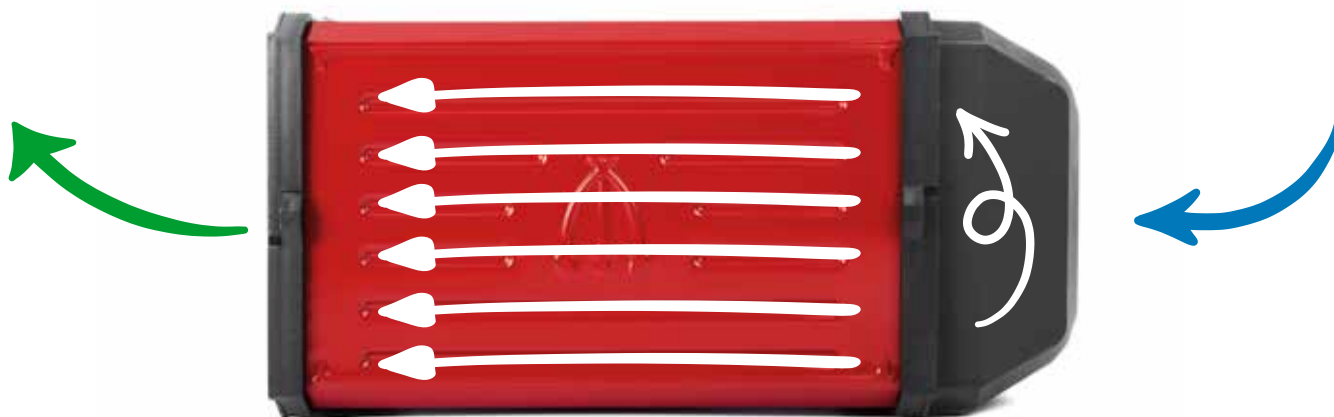
flusso d'aria orizzontale / horizontal air flow

All Atacama dehydrators have a horizontal air flow system that runs parallel to the drawers, reproducing the natural action of wind. This way air passes steadily and uniformly across all drawers, the lay of food does not obstruct the passage of air and it is therefore not necessary to reverse the order of drawers during dehydration.