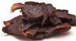
Carne Beef jerky